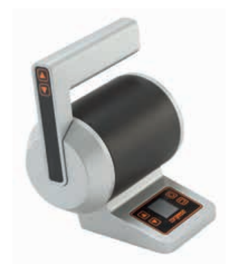
Luxe top mount