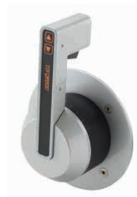
Luxe side mount